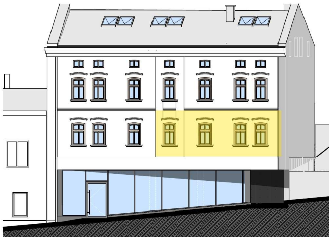
Elewacja frontowa - od ulicy Bytomskiej